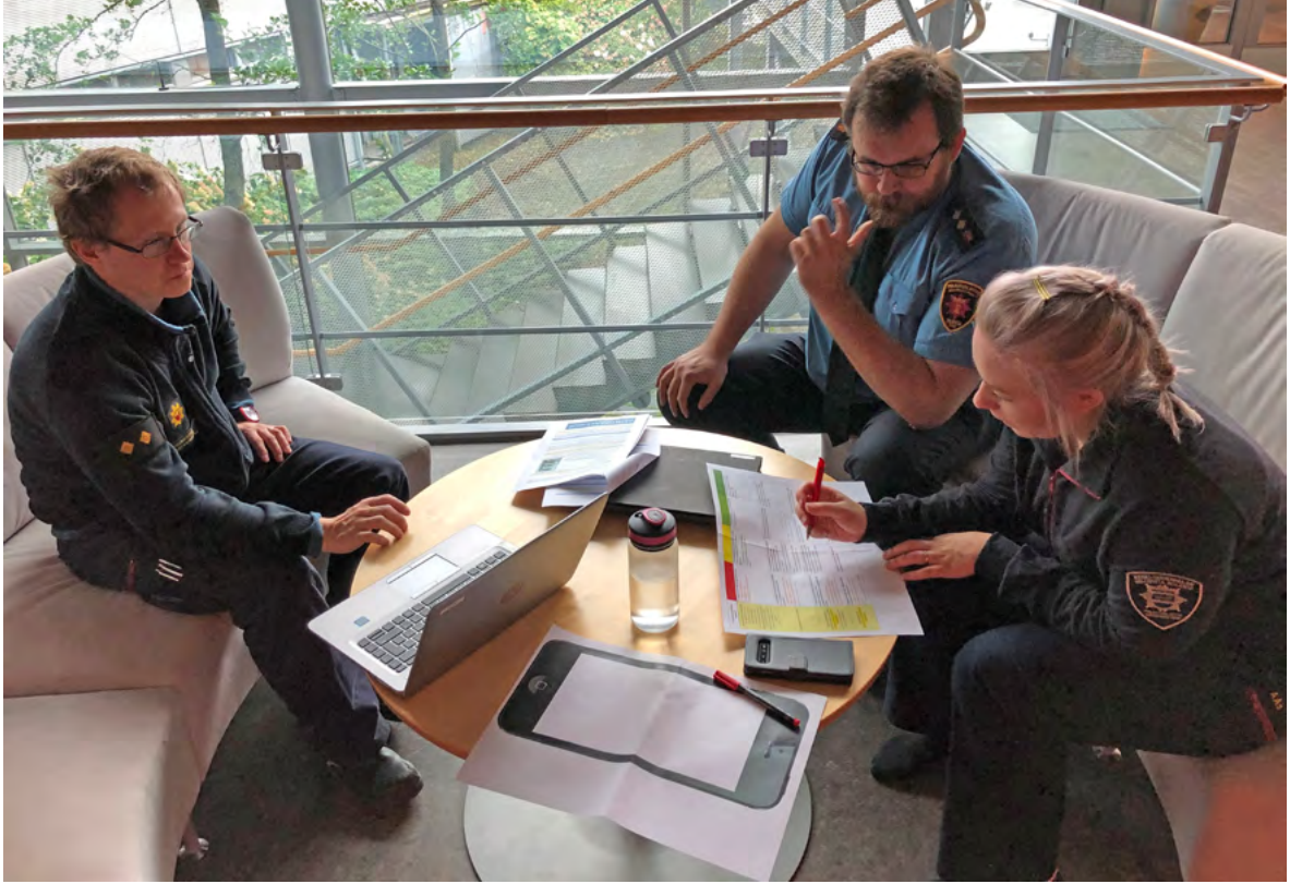
Työryhmätyöskentelyä Vantaan pelastuskeskuksella 25.9.2019.

daan muokata myös erityyppisten valvontatoimintojen tarpeisiin. Määrittelyt pitävät sisällään mm. infotekstejä ja esimerkkejä, joiden avulla pelastuslaitosten on mahdollista yhtenäistää laintulkintoja sekä jalkauttaa tehtyjä linjauksia. Sisältömäärittelyjä pilotoitiin valvontatyötä tekevien henkilöiden toimesta ja saadun palautteen perusteella tehtyjä määrittelyjä ja valvontamenetelmän rakennetta muokattiin.