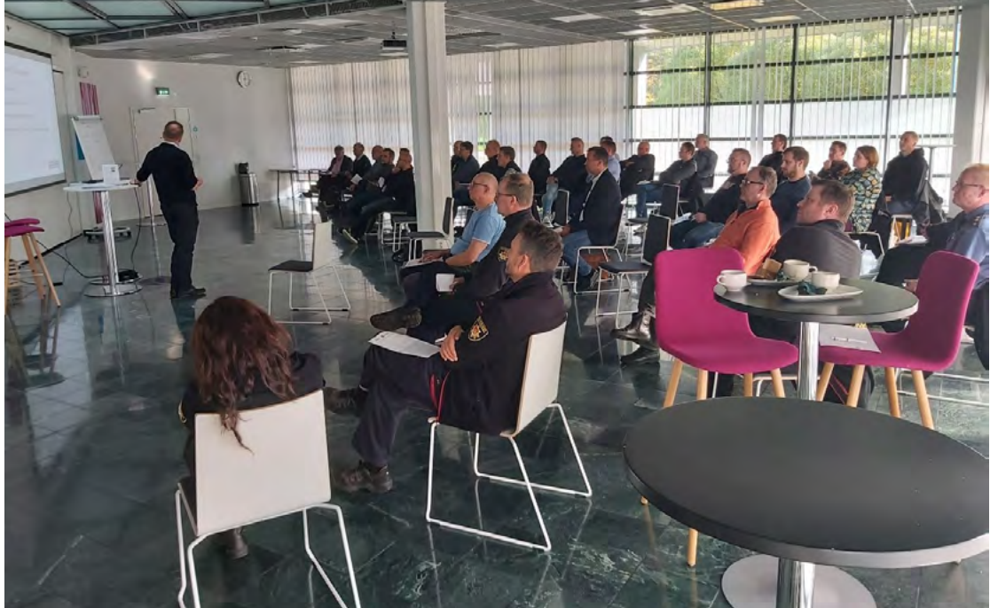
Oulussa järjestetty asiantuntijoiden seminaarilaisuus.

Yhteisen opasprojektin tulokset tiivistetysti: