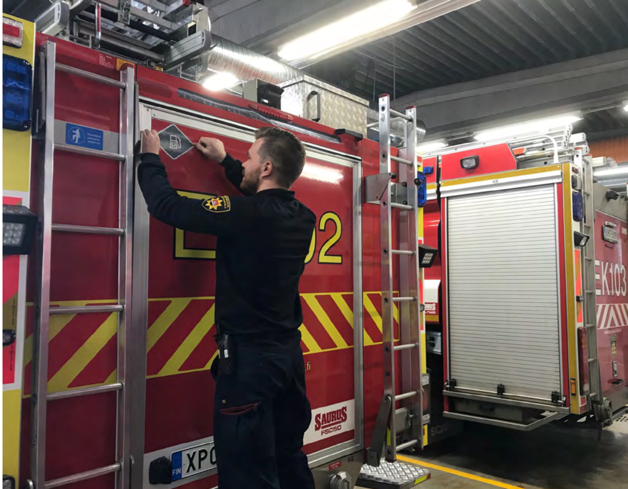
Ensimmäinen tarroitettu auto Suomessa oli Etelä-Karjalan pelastuslaitoksen uusi auto EK102. Auto otettiin käyttöön huhtikuussa 2020 tarroitettuna.