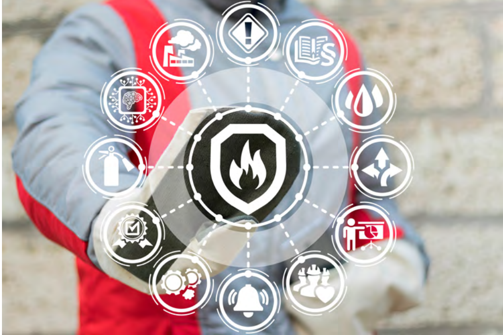
Paloturvallisuus osallistuu älyrakentamisen hankkeeseen monella osa-alueella.

Vastaavaa suomenkielistä ohjeistusta pelastushenkilöstön vesisukelluksesta ei aiemmin ole ollut käytössä.